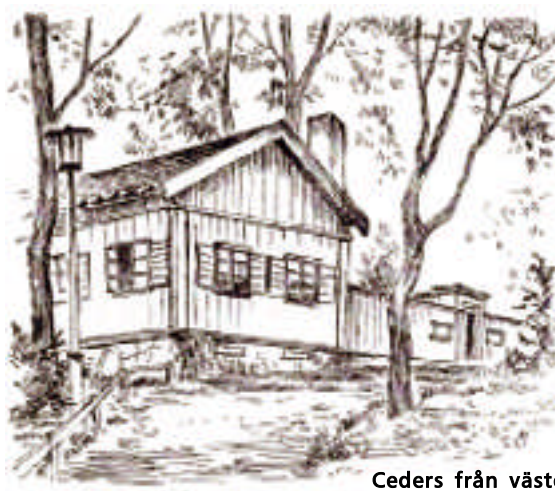
Ceders från väster Teckning av Sture Öberg

Mycket viktigt var Ceders kafé i Vitabergsparken, ett sommarkafé som VBK från 1946 fick husera i mot att de skötte huset. De satte genast i gång med att snickra och måla under ledning av dem som hade mest kunskaper.