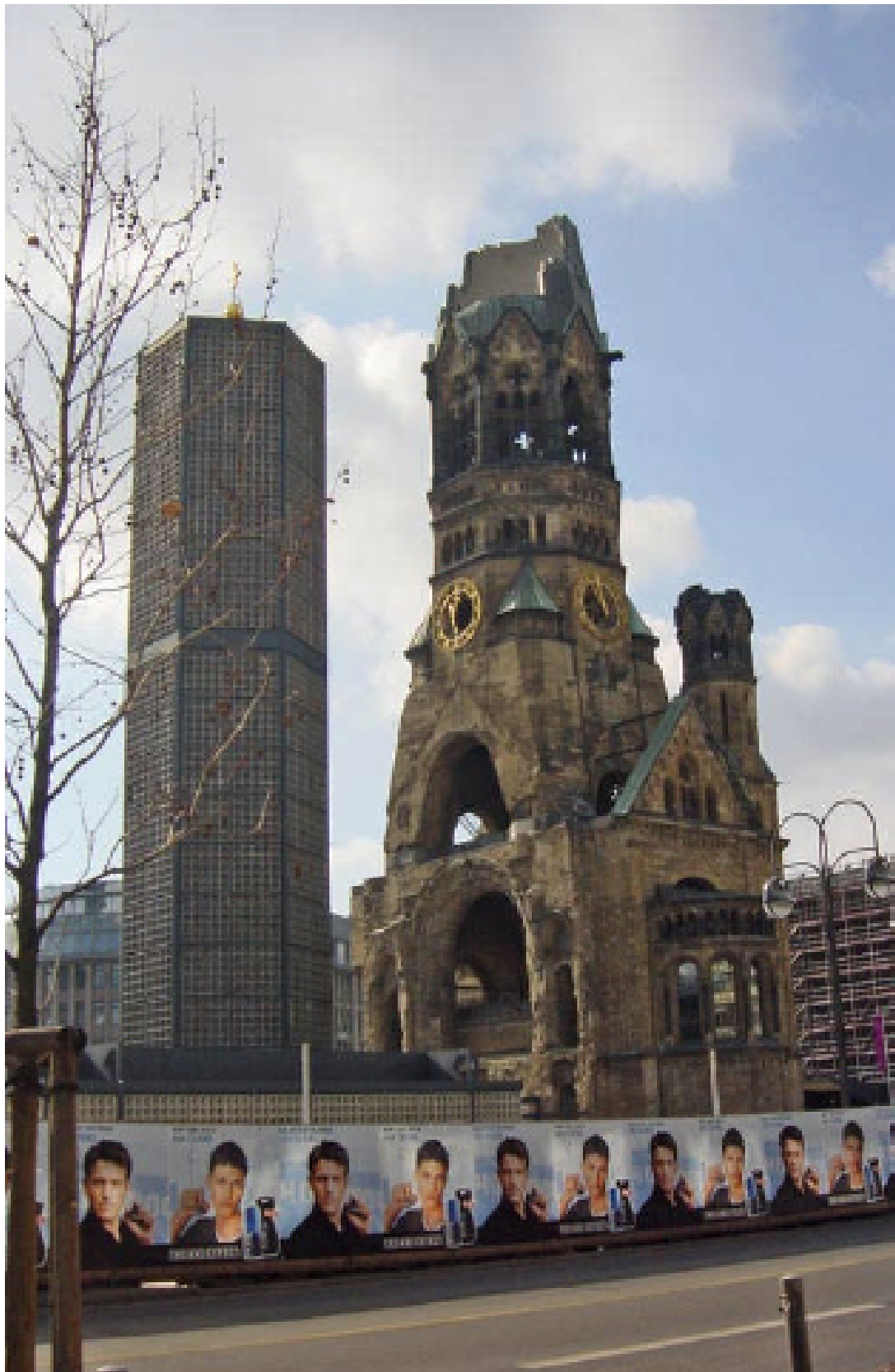
Kaiser Wilhelm Gedächtniskirche