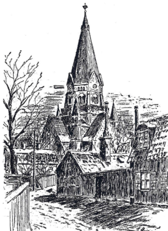
Vita Bergens gamla kåkar och Sofia kyrka