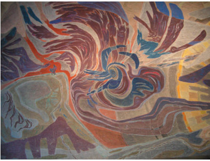
Vera Nilssons fresk i Västertorps skola

son och andra modernister. Konsten åt folket! Men i dag kommer inte folket in i trappuppgångarna. Det krävs koder. Likadant är det i många andra offentliga miljöer där konstverk försvunnit bakom lyckta dörrar.