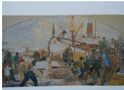
Skiss till Carl Wilhelmssons väggmålning i posthuset på Vasagatan

Jag tänker på Carl Wilhelmssons stora väggmålning i det gamla ärevördiga