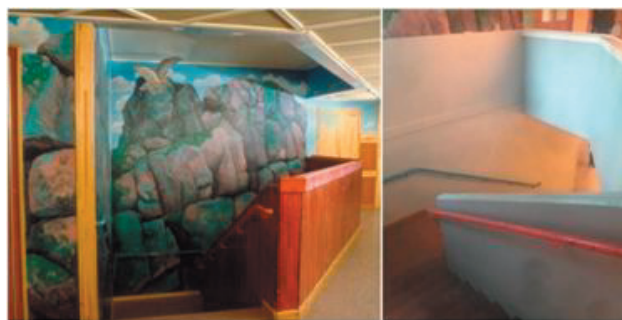
Den övermålade målningen av Peter Tillberg i Vallentuna.

Ja, rektorn har verkligen visat modet att tänka nytt genom att ansvara för att ett konstverk förstörs. Modigt, men är det riktigt klokt? Och vad är skillnaden mellan att ha ett konstverk och inte ha?