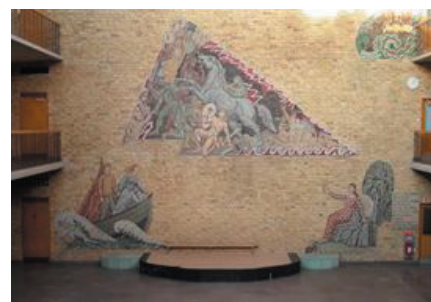
Otte Skölds väggmosaik ”Vindarnas saga” i Västertorps skola

Jag kom ihåg Otte Skölds målning från när jag väntade på mina pianolektioner och såg draken och texten om ”drakens dolska ro på guldet”. Det var spännande att som tioåring följa kampen. Nu blir resan inte av p.g.a. coronapandemin, men konstverken finns kvar.