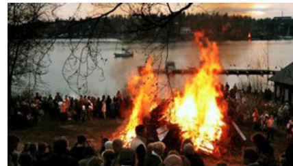
Valborgseld vid Tollare folkhögskola i Nacka utanför Stockholm.

sa "Sverigevännen" i upptuktelse – eller åtminstone ge dem en grundkurs i vårt lands historia. De nya nationalisterna vill uppenbarligen inte bara vanställa det moderna Sverige. De vill också föröda arvet från det förlutna.