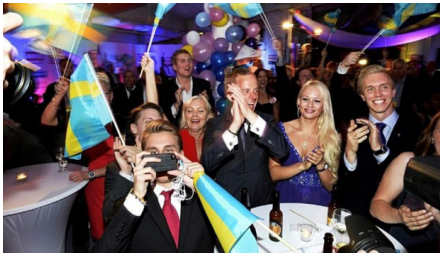
Nationalister hissar flaggan på SD:s valvaka 2014.