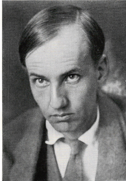
Dan Andersson, 1917

Dan Andersson växte upp i Dalar- nas finnmarksbygd i Skattlösbergs by i Grangårde församling. I denna säll- samma värld, med mörka, oändliga