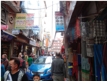
I huvudstaden Kathmandu är gatorna trånga. Fordonens signallhorn dominerar trafikens ljudbild.

Tillsammans med 13 kamrater gjorde jag en resa till Nepal under ett par veckor i början av mars i år (2015). Det var en fysisk utmaning eftersom vi cyklade tre dagar i backarna i och kring staden Pokhara och vandrade fem dagar i bergsområdet i västra Nepal. Den sista cykeldagen skulle vi ta oss upp för en mycket brant backe. Det var ett par mil cykling, bara uppför. Den sista backen var så brant att om man lutade sig lite för mycket framåt, slirade bakhjulet och om man lutade sig för mycket bakåt, stegrade sig cykeln.