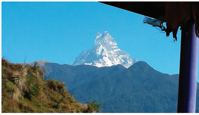
Fishtail - en av Himalajas toppar

sig till guider och bärare. Ofta odlar man grönsaker och bönor själva. I de svårtillgängliga bergstrakterna som är så attraktiva för turister sker transporter med hästar och åsnor. Alla vandrande sällskap har bärare. Det är ofta unga pojkar i 20-30 årsåldern som tjänar lite extra pengar under turistsäsongen. Det är inte ovanligt att de bär på 40 kg medan vi turister har våra ryggsäckar på 10 kg.