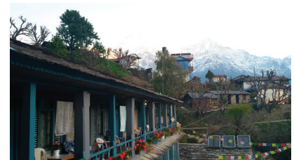
På vissa platser fanns relativt stora hotell. Hotelstandarden var naturligtvis inte som i västvärlden.

Nepaleserna i bergsområdena livnär sig mycket på turismen, t.ex. vandrare som vår grupp. Familjer erbjuder enkel övernattningsmat och förnödenheter. En del utbildar