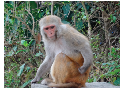
Apor finns överallt, även i städerna.

I Pokhara mötte vi många tibetanska flyktingar som flytt från Kina. De livnärde sig på hantverk som de sålde till turister. Tibeterna är bara en av många etniska grupper i Nepal. Det finns sammanlagt ett tjugotal olika kulturer.