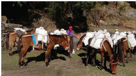
Hästar är transportmedlet i bergstrakterna

En förbättrad infrastruktur med farbara vägar i bergstrakterna har skett under de senaste decennierna men detta har inte enbart varit