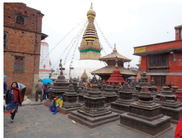
Helig plats i Kathmandu. Hit vallfärdar folk vid de religiösa högtiderna

Det var intressant att se hur människor strävade för att få tillvaron att gå ihop med mycket knappa resurser. Landet är fattigt även om jordarna är bördiga. Många ska försörjas. Huvudnäringen är jordbruk som sysselsätter 75 procent av befolkningen. Hela 25 procent av BNP utgörs av utlandsarbete