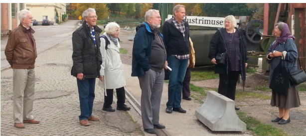
Rektorn omgiven av veteraner

Motala kommun köpte alla lokaler efter nedläggningen av Motala Verkstad och nu planerar man kulturaktiviteter i de K-märkta verkstadslokalerna. Det har startats en förening, Verkstadsliv, för alla som har verksamheter inom området. Skolans rektor är ordförande. Man planerar musei-, kultur- och föreningsverksamhet.