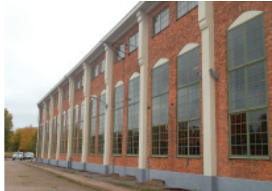
Lokal med potential. Gamla lokverkstaden.

Skolan har ett stort antal kurser förutom allmän kurs bl.a. teaterlinje, journalistutbildning och distanskurser.